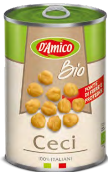
Ceci Bio Organic Chick Peas