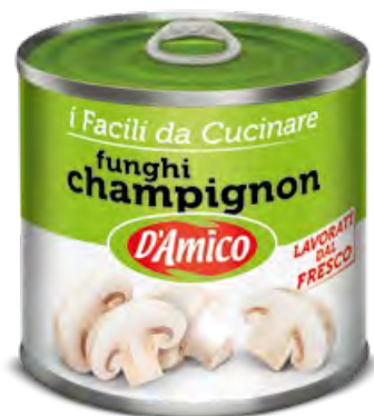
Funghi Champignon tagliati Sliced Champignons