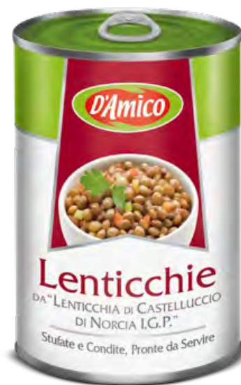
Lenticchie di Castelluccio di Norcia I.G.P. stufate e condite Stewed and Seasoned Castelluccio di Norcia P.G.I. Lentils