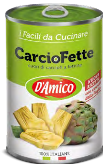
Carciofette "cuori di carciofi a fettine" Carciofette "sliced artichoke hearts"