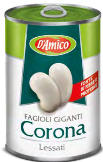
Fagioli Corona giganti Giant Corona Beans