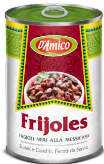
Frijoles fagioli neri alla messicana Frijoles Black Beans "Mexican Style"