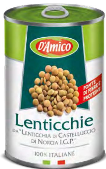
Lenticchie di Castelluccio di Norcia I.G.P. Castelluccio di Norcia P.G.I. Lentils