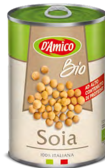
Soia Bio Organic Soy Beans