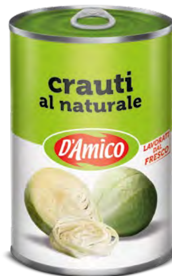
Crauti al naturale Sauerkraut