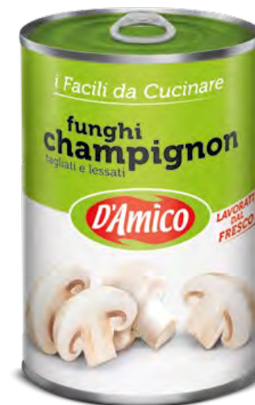
Funghi Champignon tagliati Sliced Champignons