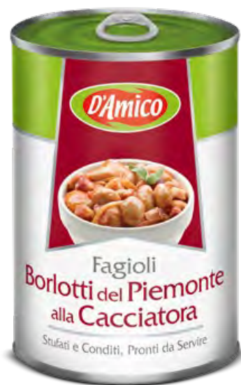
Fagioli Borlotti del Piemonte alla Cacciatora stufati e conditi Stewed and Seasoned Borlotti Beans of Piemonte "Cacciatora Style"