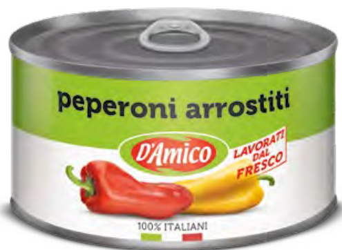
Peperoni arrostiti "interi e spellati" Chargrilled Peppers "whole and peeled"