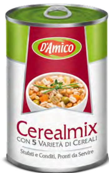
Cerealmix misto di cereali, ortaggi e legumi stufati e conditi Cerealmix Mixed Cereals, Stewed and Seasoned Legumes and Vegetables