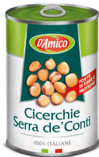
Cicerchie Serra de' Conti Serra de' Conti Grass Peas