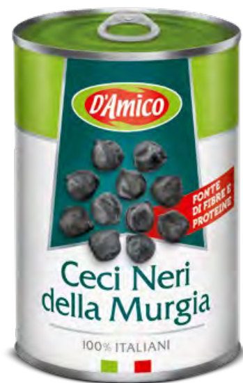
Ceci neri della Murgia Black Chick Peas of Murgia