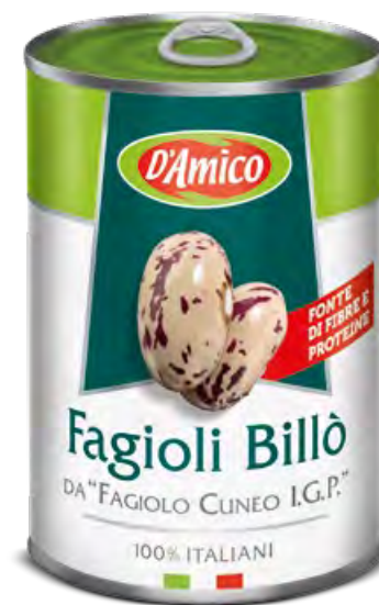
Fagioli Billò da "Fagiolo di Cuneo I.G.P." Billò Beans from "Fagioli di Cuneo P.G.I."