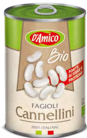
Fagioli Cannellini Bio Organic Cannellini Beans