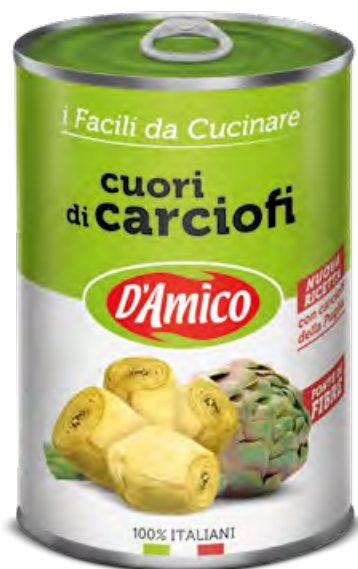
Cuori di carciofi interi Artichoke Hearts