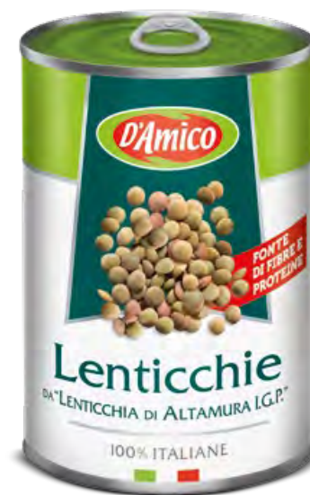
Lenticchie da "Lenticchia di Altamura I.G.P. Altamura P.G.I. Lentils