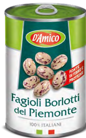
Fagioli Borlotti del Piemonte Piemonte Borlotti Beans