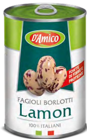
Fagioli Borlotti Lamon Lamon Borlotti Beans