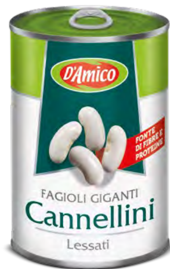
Fagioli Cannellini giganti Giant Cannellini Beans