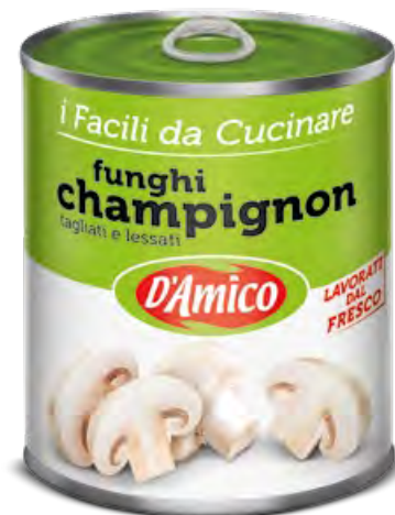
Funghi Champignon tagliati Sliced Champignons