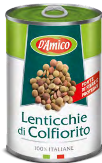
Lenticchie di Colfiorito Colfiorito Lentils