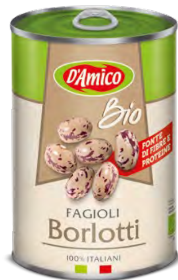
Fagioli Borlotti Bio Organic Borlotti Beans