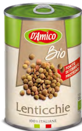
Lenticchie Bio Organic Lentils